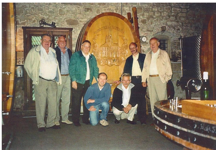
2005 Sortie du comité à Payerne